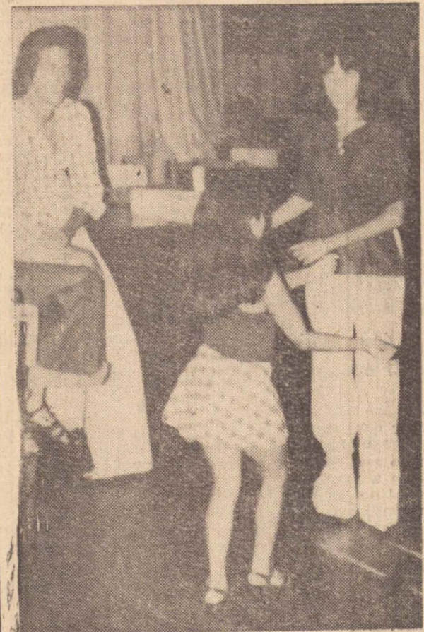
flagrante colheu de improviso e de costas, uma jovem passista dos "Malacos"