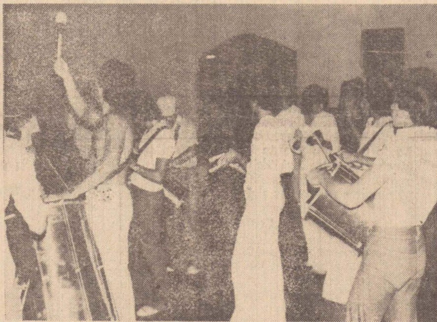
As baterias estão afinadas e as cuicas já estão roncando, na escola de samba "Malacos do Tenis Clube"

"Nosso objetivo este ano — disse um dos dirigentes dos "Malacos" — é incentivar o carnaval prudentino, principalmente para levar as ruas um pouco de alegria ao nosso povo. Não pretendemos disputar qualquer prêmio. Nem por isso estaremos menos animados do que nos anos anteriores. A turma está bem preparada para animar o carnaval deste ano e levar um pouco de atração ao povo que vem às ruas".