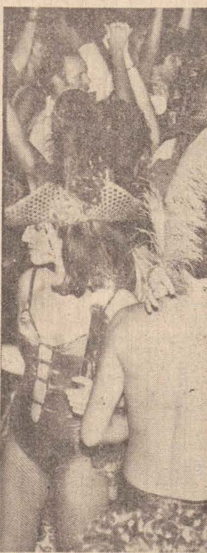
Os bailes nos clubes serão rigorosamente policiados