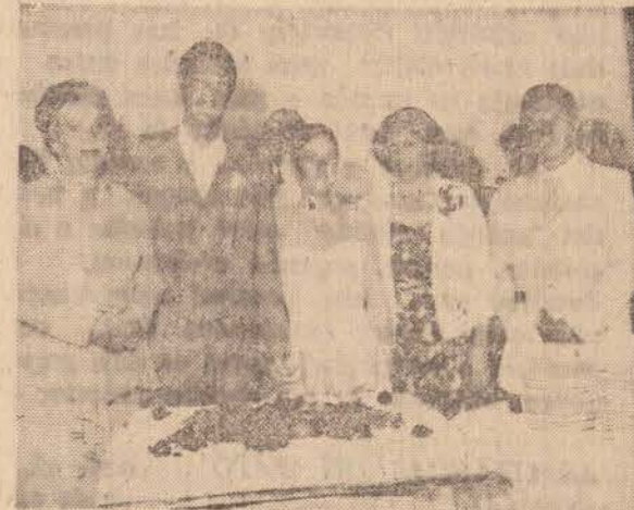
Os noivos ladeados de seus pais