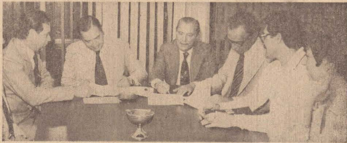
O prefeito de P. Prudente assina o contrato de empréstimo na Caixa, acompanhado do deputado Walter Lemes Soares...