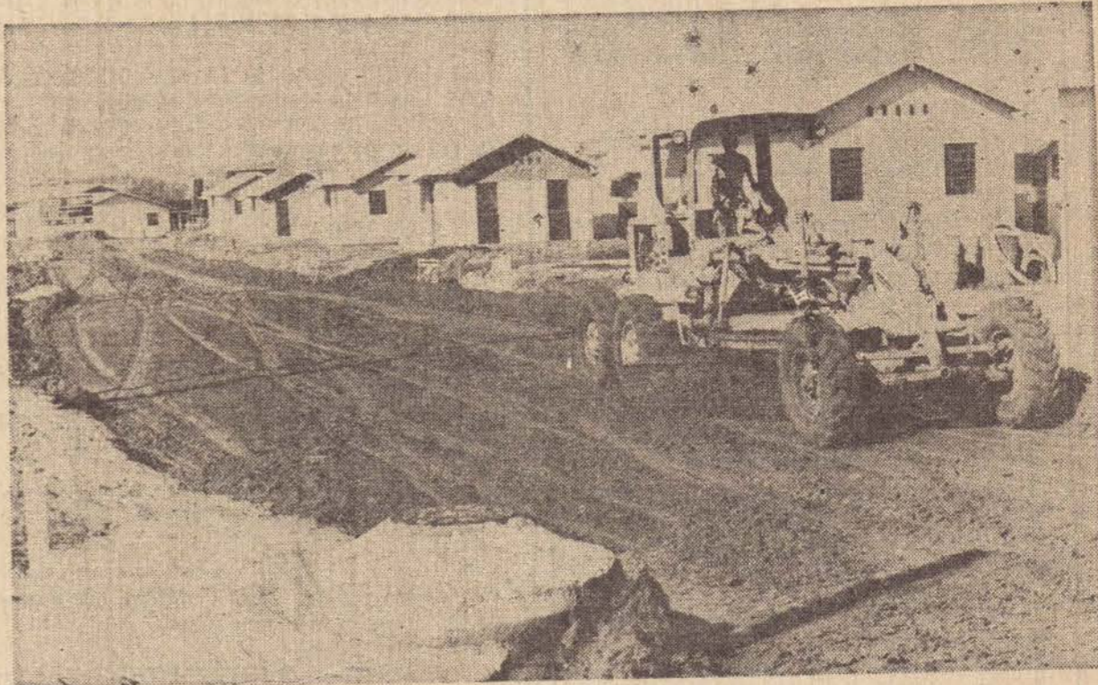
Serão executados 50 mil metros quadrados de asfalto no novo conjunto habitacional.

Mesmo na instalação provisória da entidade, o Serviço de Obras Sociais vem realizando um trabalho junto aos engraxates, oferecendo-lhes uniformes, merendas e assistência às suas necessidades básicas. Atualmente a Casa do Pequeno Trabalhador conta com 480 menores inscritos, um grande esforço para retirar o menor da ociosidade nas ruas, mas levando-o a desenvolver pequenas atividades. Ao ato da inauguração da nova sede da instituição deverão estar presentes as autoridades do município, principalmente daquelas ligadas à promoção do menor.