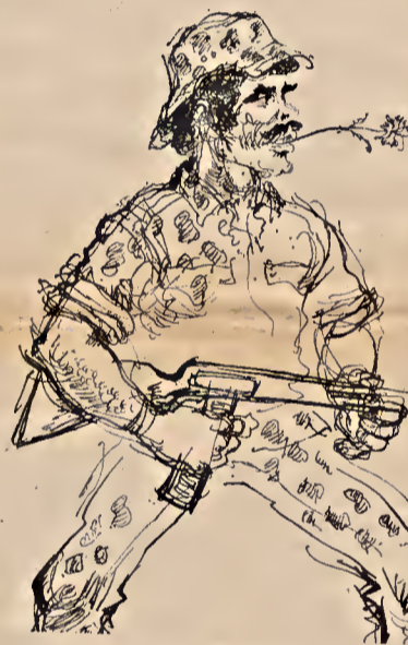
Dibujo de Kerleroux

Las reivindicaciones de los obreros metalúrgicos y de la construcción son aprovechadas para desarrollar amplias movilizaciones antigubernamentales y el F.U.R., hipotética agrupación de los partidos de izquierda, a los cuales se alía el P.C.P., lanza nuevas manifestaciones de protesta. A su vez, maniobrados por sargentos afectos al P.C.P., los paracaidistas son objeto de movilización contra el mando de las Fuerzas Aéreas y ocupan varias bases militares. Tanto el F.U.R. como el P.C.P. contaban que la agitación obrera y el apoyo de algunas Comisiones de Empresa habían de permitir, una vez movilizadas los militares, que las multitudes acudieran a los cuarteles para armarse y conquistar el Poder. Por otra parte, ocupadas la Radio y la Televisión y disponiendo de un amplio sector de la Prensa especialmente con-