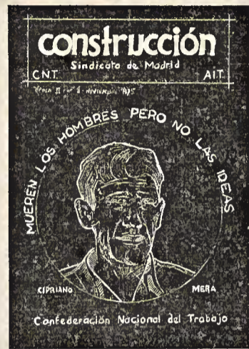
Portada del primer número de «Construcción» y su suplemento de noviembre 1975