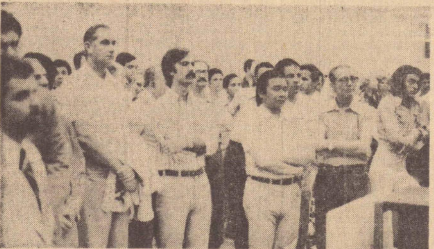
A classe empresarial, prestigiou o ato inaugural