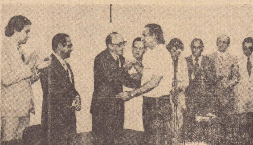
O vice-prefeito, cumprimenta o diretor do Banco