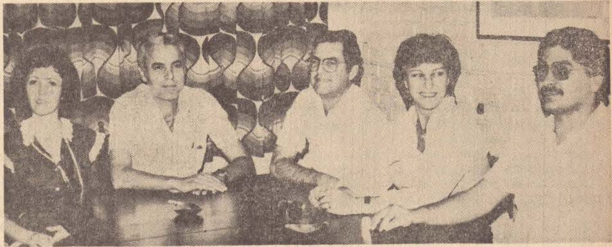
O ex-procurador mostrou-se contente pela recepção proporcionada pelos companheiros e visitou a redação de O Imparcial.

"Vocês já imaginaram um candidato a deputado prometer na televisão que, se eleito, vai baixar os juros ou extinguir a correção monetária, por exemplo? Acho que isso um crime".