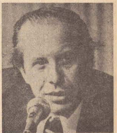
Mário Henrique Simonsen

Ao ser indagado se a sua proposta não representava o retorno ao "arrocho salarial", responsável por perda substancial do poder aquisitivo do trabalhador, o ex-ministro limitou-se à seguinte resposta: "houve defasagem, mas não