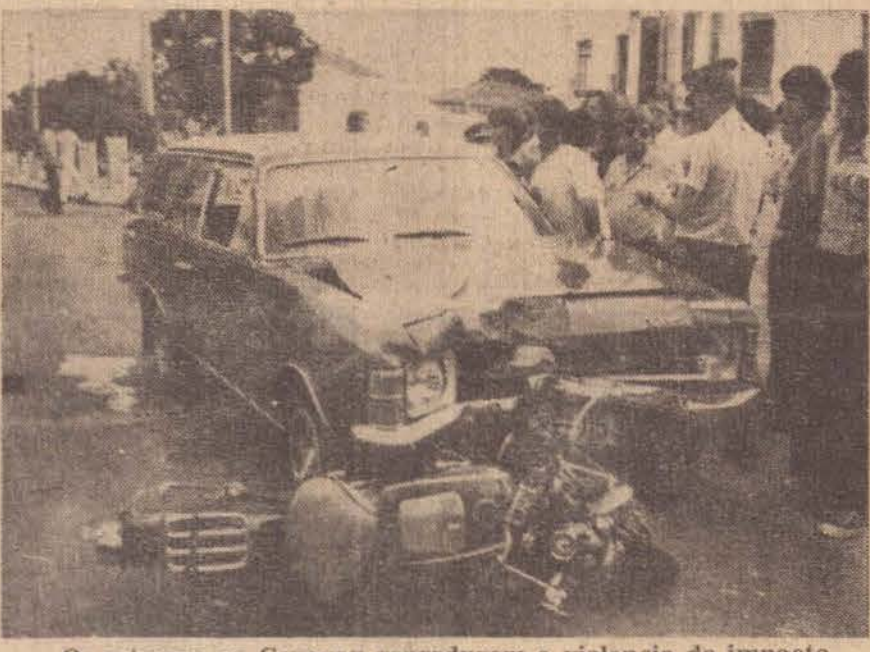
Os estragos na Caravan reproduzem a violência do impacto

O motociclista, com a força do impacto, foi jogado em cima do capô do veí-