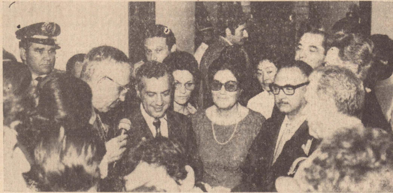
D. José Gonçalves da Costa e o governador, na inauguração do Centro de Triagem Social.

O governador Laudo Natel cumpriu ontem uma acidentada viagem à região da Alta Sorocabana. Logo que a composição ferroviária em que viajava deixou a Capital quarta-feira, houve princípio de incêndio num vagão onde se encontrava o pessoal de segurança.