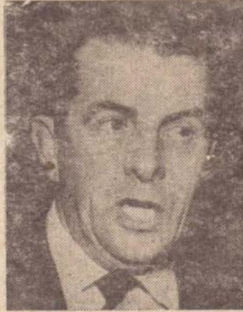
JARBAS PASSARINHO — Ministro do Trabalho

Se o protesto pegar: VEREADOR EM P.P. VAI FATURAR MILHÃO