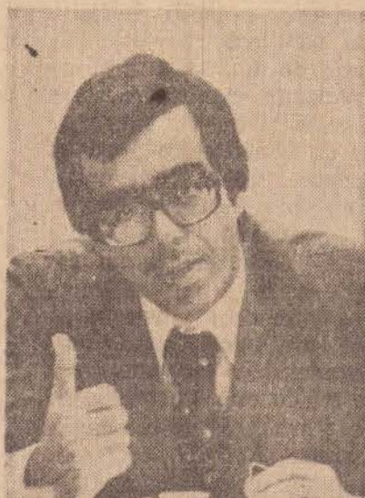
Para Langoni, os subsídios é que levam à emissão de papel moeda, causadora de inflação.

ficam quando puderem ser cobertos por recurso obtidos no orçamento fiscal, isto é, pelo excesso de receita tributária ou pela captação de recursos, no mercado de capitais — argumenta Langoni, não é, entretanto o que acontece. Em 1980, por exemplo, o total de subsídios foi de Cr$ 745 bilhões. Correspondendo a cerca de 78 por cento do total da Receita Tributária, ou seja, à receita conjunta do imposto de renda, IPI, IOF, de outro ângulo, o governo gastou com esses subsídios o equivalente às despesas diretas dos Ministérios dos Transportes, Assistência e Previdência Social; Educação e Cultura; Defesa Nacional, Energia, e Recursos Minerais; Agricultura; Saúde e Saneamento e Comunicações.