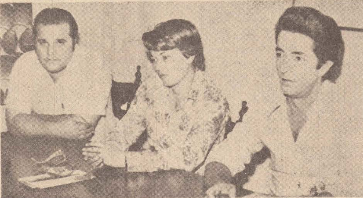
Os filatelistas acham um absurdo os Correios reajustarem o preço do carimbo de Cr$ 1.500,00 para Cr$ 48.000,00.