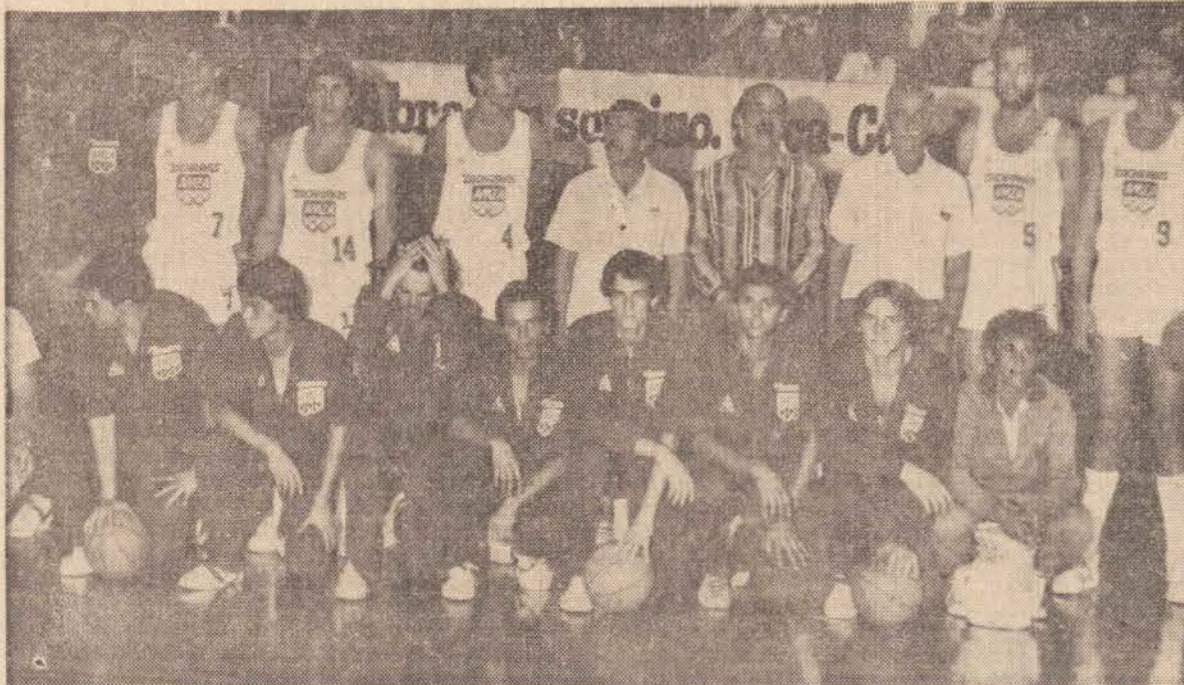
Equipe do Grupo Zacharias