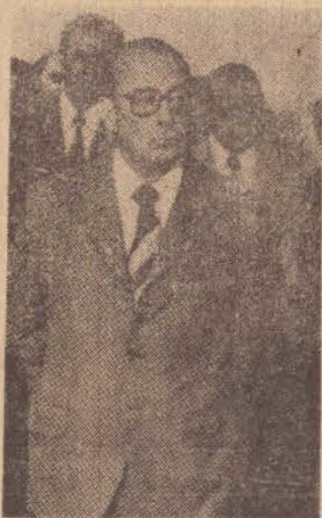
Após a cirurgia plástica a que se submeteu, o presidente evita sua aparição em público

Porto Alegre, ele embarcará para o Rio de Janeiro, onde no dia 14 assistirá a formatura do Corpo Auxiliar Feminino da Reserva da Marinha, terá um almoço com as classes produtoras e assistirá ao batismo e lançamento ao mar de