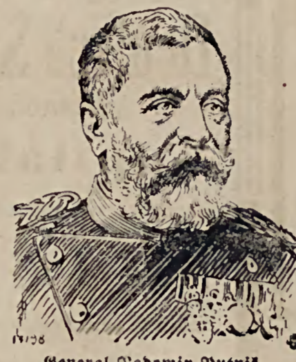
General Radomir Putnik, Chef des serbischen Generalstabes.