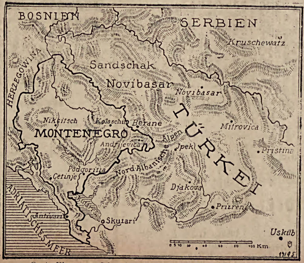
Kartenzüge vom Schauplatz der ersten Kämpfe im Balkanrieg: Montenegro und die Grenzgebiete von Serbien, Ungarn, Serbien und der Türkei inselb.