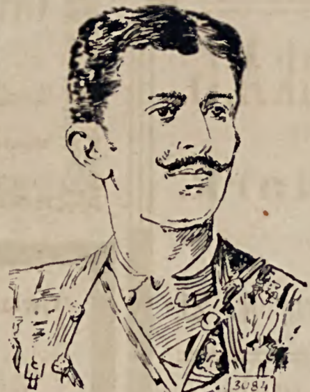
Prinz Danilo von Montenegro, Oberbefehlshaber der montenegrinischen Heere.