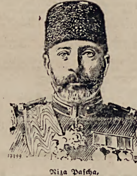
Nisim Pascha, der Führer des auf seinen Befehl kämpfenden albanischen Sturms.