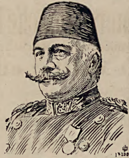
Nisim Pascha, Oberbefehlshaber der türkischen Heere.