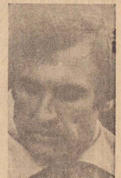
René Arnoux, da equipe Renault da França.

Agora Allan Jones (australiano) é o líder do Campeonato Mundial de Pilotos.