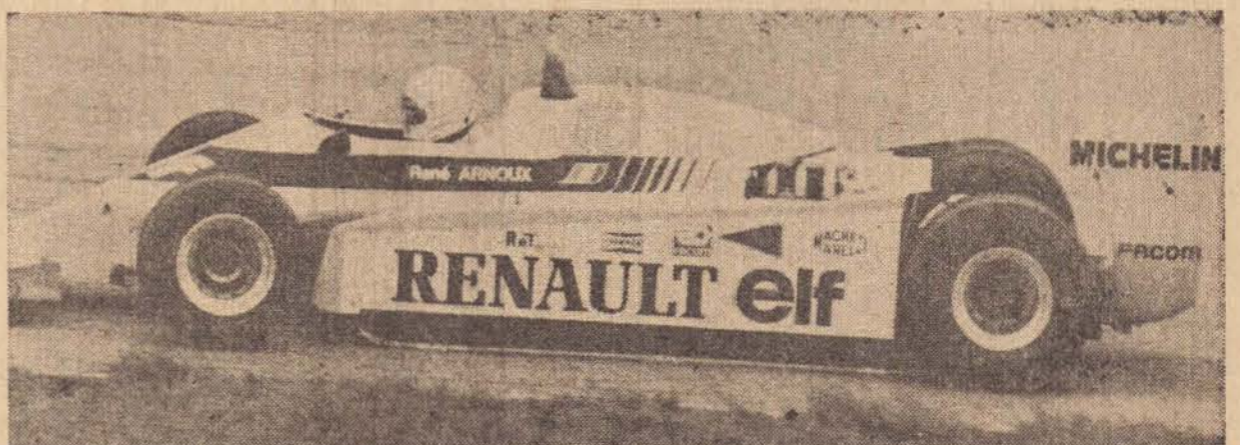
René Arnoux venceu em meio aos azares de muitos concorrentes.

Cid Buchalla testemunhou domingo, no Autódromo de Interlagos, a inesperada vitória de René Arnoux, da equipe Renault da França, no Grande Prêmio Brasil de Fórmula-1.