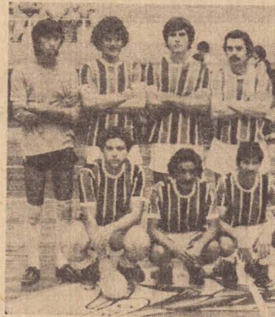
Explosivo, campeão do Torneio Confraternização

Faltando 34 dias para o início do campeonato de acesso a diretoria do Corinthians PP espera estar com o plantel montado até o próximo dia 10 iniciando em seguida alguns amistosos para definir o time para a estreia no certame dia 02 de março.