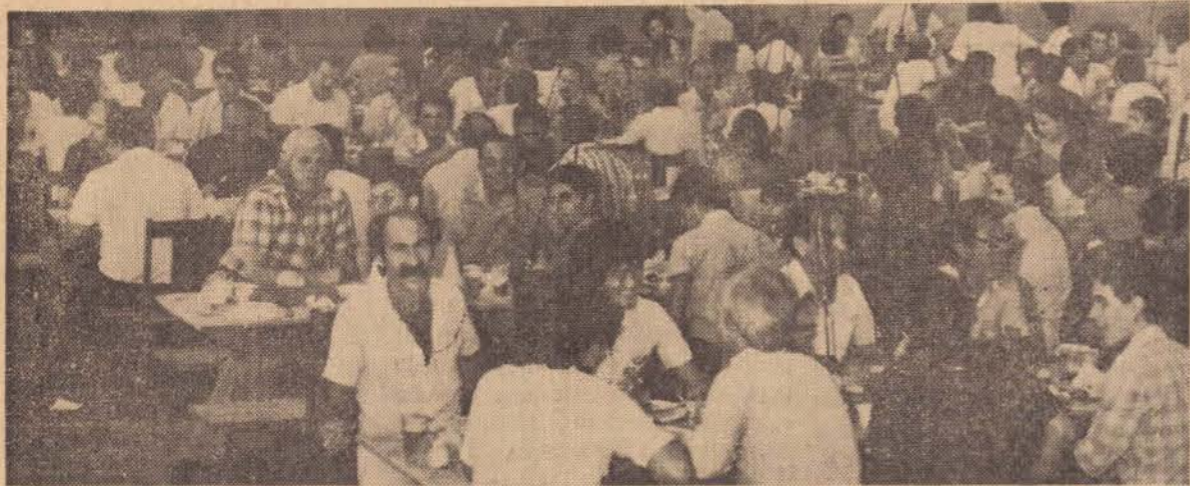
Um aspecto parcial do interior dos salões da SORAUTO, durante o churrasco de confraternização que a conhecida empresa ofereceu às classes empresariais de nossa cidade, marcando mais um ano de investimentos do grupo concessionário Volkswagen, em Presidente Prudente.