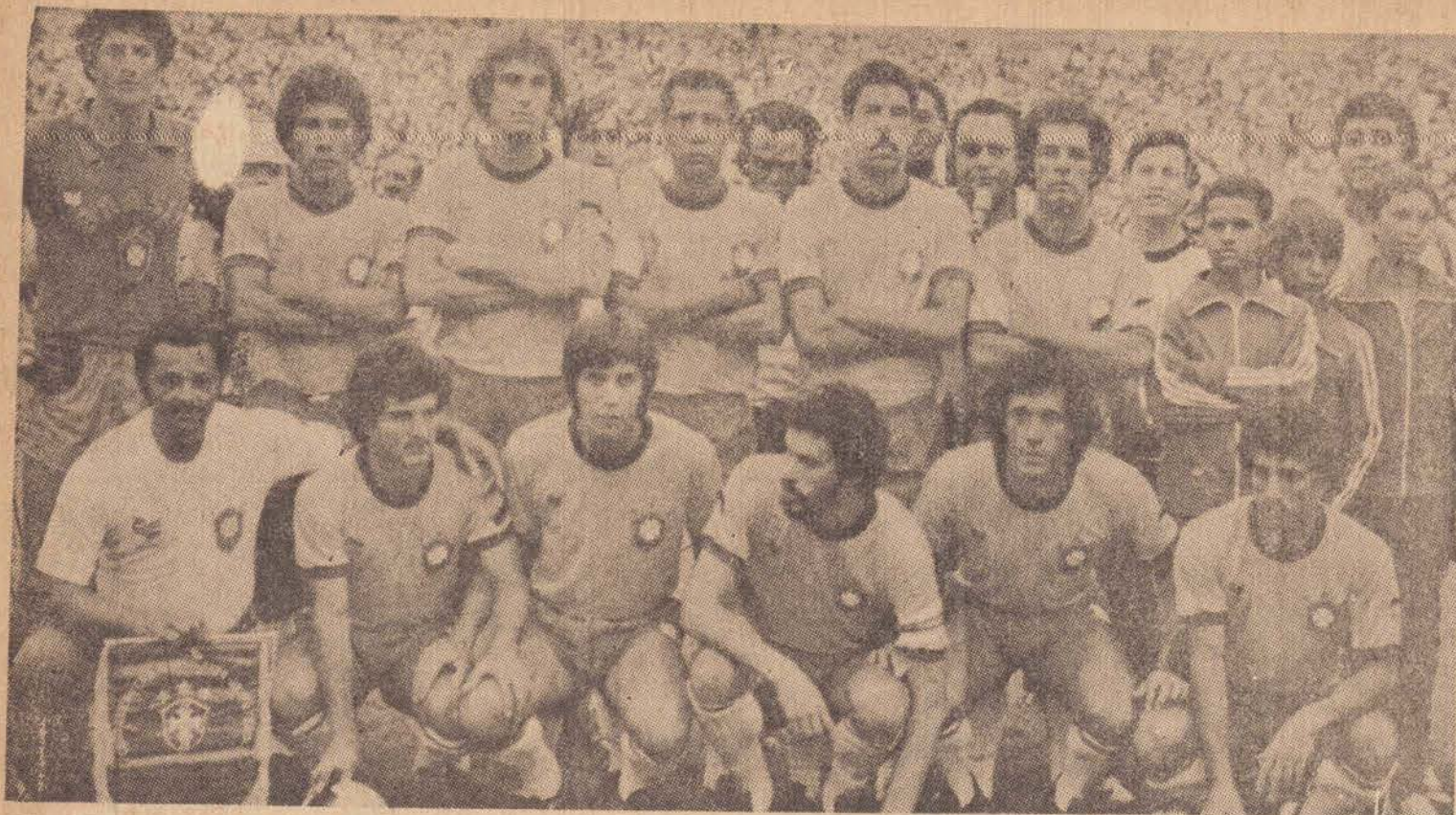
A Seleção Brasileira que hoje vai decidir a Copa de Ouro com a seleção do Uruguai.