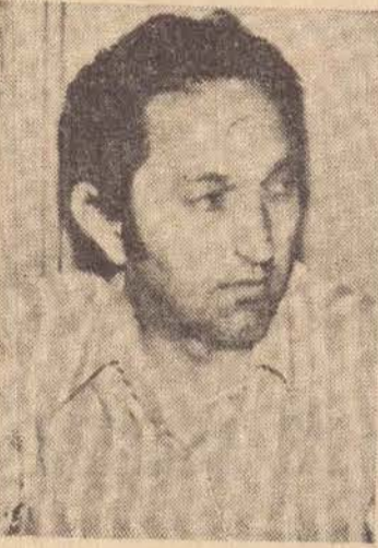
AUTARQUIA MUNICIPAL DE ESPORTES E OS JOGOS ABERTOS

Estádio Municipal — 10,00 horas Guarani F.C. x Nacional E.C. Estádio Municipal — 16,00 horas E.C. Vila Gloria x Municipal A.C. Estádio do Rio 400 — 9,00 horas Cortume Rotta F.C. x E.C. Prudentina