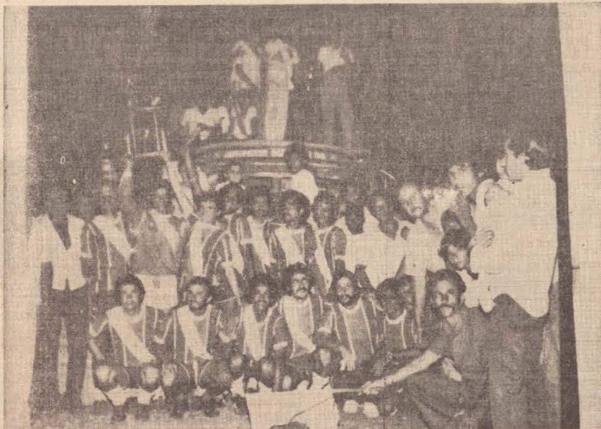
Na foto, já em Rosana, diretores, craques, torcedores do Dameta comemorando a conquista do longo campeonato e mostrando o troféu Ruy Silva.