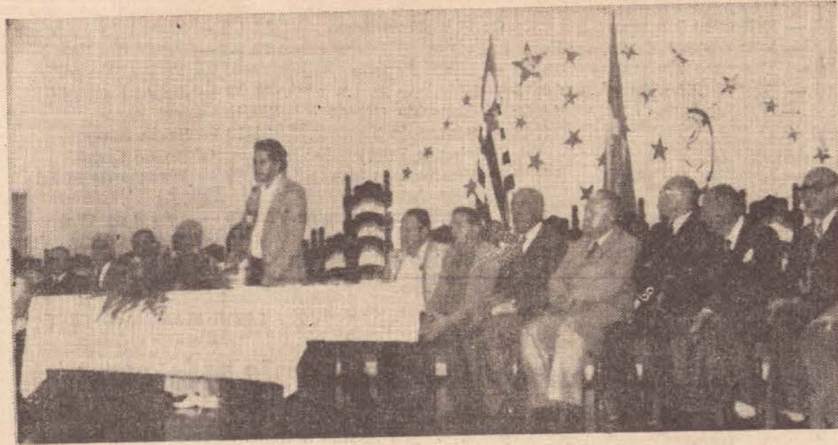
Flagrante das solenidades no anfiteatro da APEC em homenagem aos ex-combatentes da Revolução.