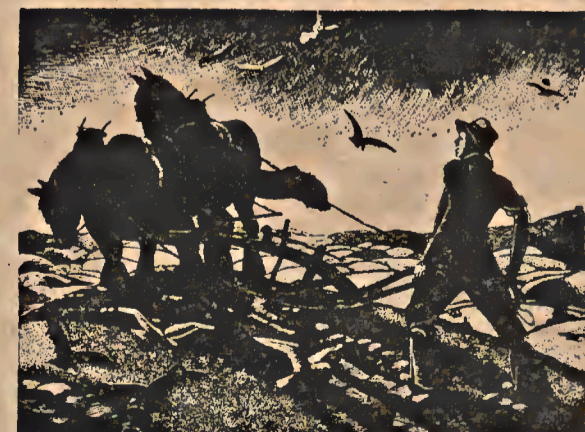
CLARE LEIGHTON

LIBERATION — July 1969 Volume 14. Nr. 4. Rivista pacifista libertaria in lingua inglese. Ind.: 339 Lafayette Street, New York City 10012.