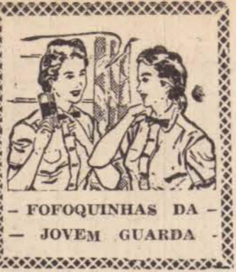
FOFOQUINHAS DA JOVEM GUARDA