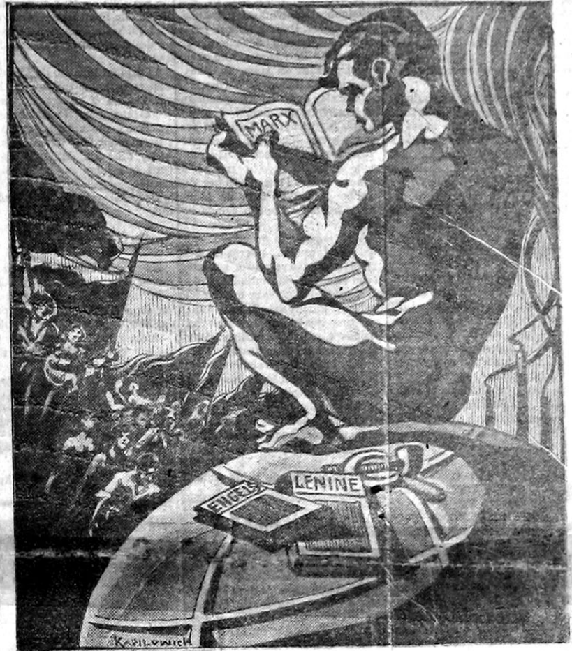
Trabalhadores do mundo. Uni-vos!...

Em Nichero, os communistas distribuíram dois manifestos num total de 4.500 exemplares. Em S. Paulo, lançaram um manifesto e espalharam numeros antigos da «A Classe Operaria». Em Santos editaram um numero especial, com seis paginas do «O Solidario». Em Sertãozinho, Estado de São Paulo lançaram um manifesto e o jornalzinho «O 1.º de Maio». Em Ribeirão Preto, fizeram uma passeta e uma sessão solenne. Em Victoria, capital do Espirito Santo, um manifesto que, infelizmente, provocou algumas prisões. Em Manaus, Fortaleza, Natal, Arica Branca, Alagoas do Remigio, Guaibira, Parahyba, Arica, Mos-