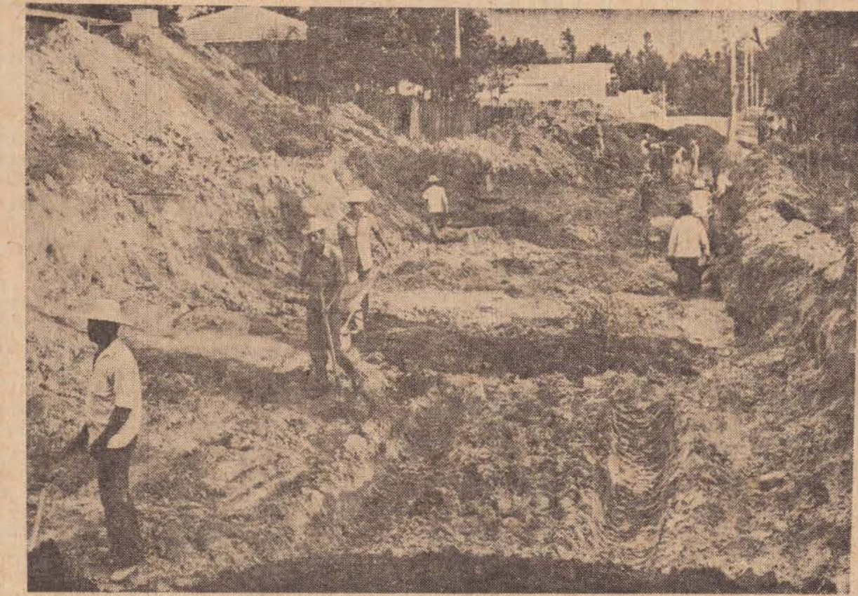
Na foto, aparecem funcionários da Prudenco realizando o trabalho de infra-estrutura, para asfaltar mais uma rua do Jardim Caiçara.