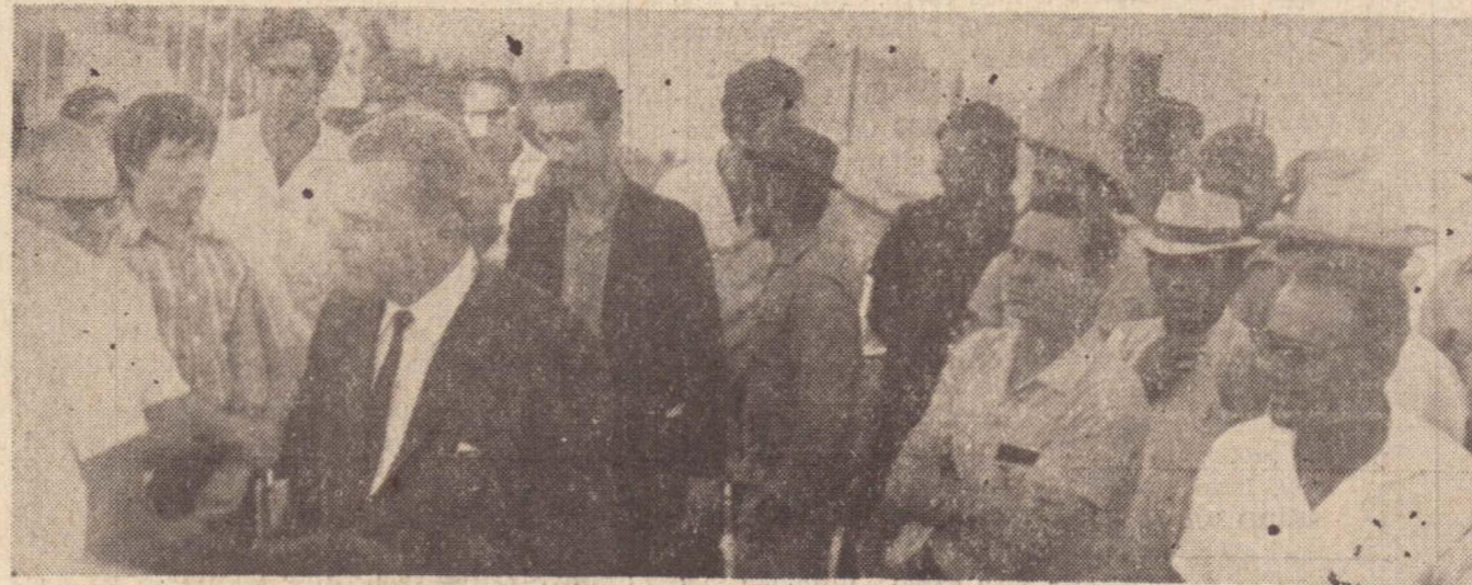
Cercado de assessores, o prefeito recebeu cumprimentos dos presentes, pela conclusão da tão esperada obra.

DESDE ONTEM ESTÁ ABERTO AO TRÁFEGO DE VEÍCULOS, O NOVO PONTILHÃO QUE A MUNICIPALIDADE CONSTRUÍU SOBRE OS TRILHOS DA ESTRADA DE FERRO SOROCABANA NA LIGAÇÃO A RUA BARÃO DO RIO BRANCO COM A VILA MARCONDES. A ABERTURA SE FEZ A TÍTULO PRECÁRIO PARA FACILITAR O ESCOAMENTO DO TRÁFEGO COM AQUELE POPULOSO BAIRRO, ATÉ QUE SE DE A INAUGURAÇÃO OFICIAL NO DIA 14 DE SETEMBRO, POSSIVELMENTE.