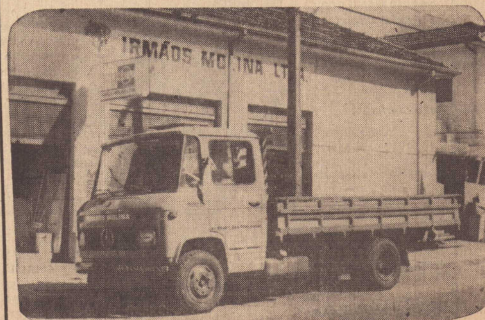
L-608D (MERCEDINHO) - MAIS UM PRODUTO DA Mercedes - Benz do Brasil S.A