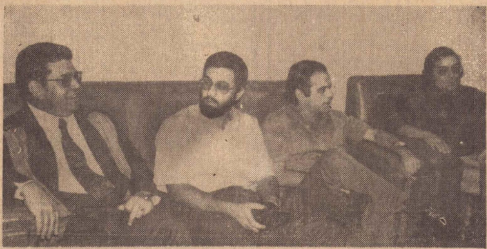
Um flagrante da visita do diretor do CEPAM às instalações deste jornal.

O Centro de Estudos e Pesquisas de Administração Municipal —