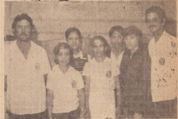
Os estudantes e integrantes da "Presidente Médici", quando visitavam as dependências do Imparcial.