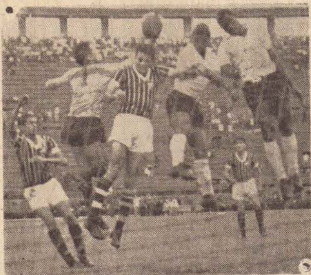
Rio-São Paulo prossegue amanhã e depois

e o regresso acontecerá do prélio logo após o encerramento