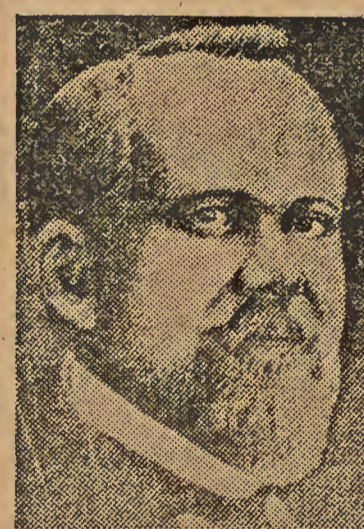
Poincaré La Guerre, um dos responsáveis pela matança de 1914

PARIS, 15 (U. P.) — Pouco depois de sua morte, Raymond Poincaré,