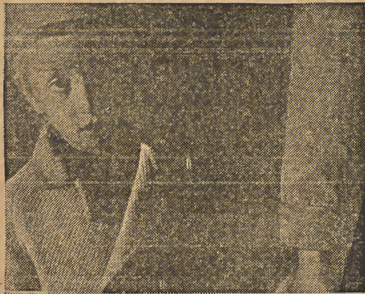
No "Dia da Criança" as senhoras de peliças caras dão esmolas e voltam para a casa contentes, convencidas de ter feito a "caridade". Foi assim, quando baptisaram numa escola um "bebê" de porcellana, enquanto morriam, pelo Brasil afôrs, dezenas de bebês de verdade que não tinham pão para comer...