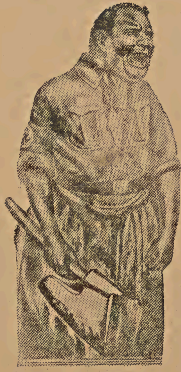
Goering, que incarna o poder executivo da reacção nazista

demnado á morte em 26 de outubro de 1933, pelo tribunal de Plenzlan;