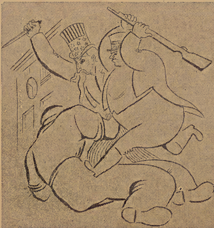
A triste posição em que se encontra o trabalhador da Light

conclusões positivas, opinando pela revisão, logo no inicio do governo do ratazana Bergamini. Mas Bergamini ficou protelando, negaceando, adiando uma resolução sobre o assumpto, até o fim do seu governo. Ah! então, cuspido da Prefeitura, Bergamini gritou que estava "quasi" terminan-