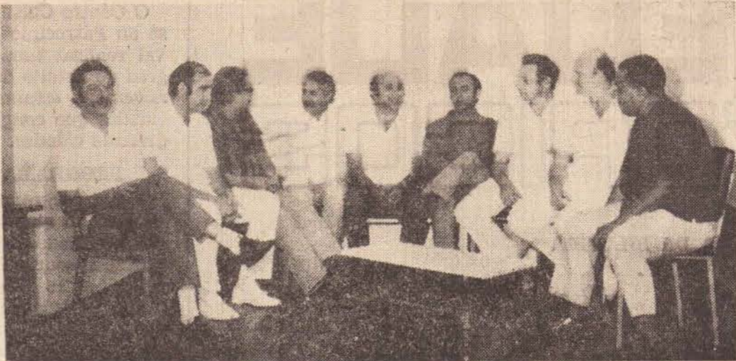
Na foto os médicos da "URGÊNCIA" Nossa Senhora das Graças quando atendiam a reportagem

Naturalmente com esse título os leitores vão estar treinando, porém, é muito simples, pois o Hospital Nossa Senhora das Graças