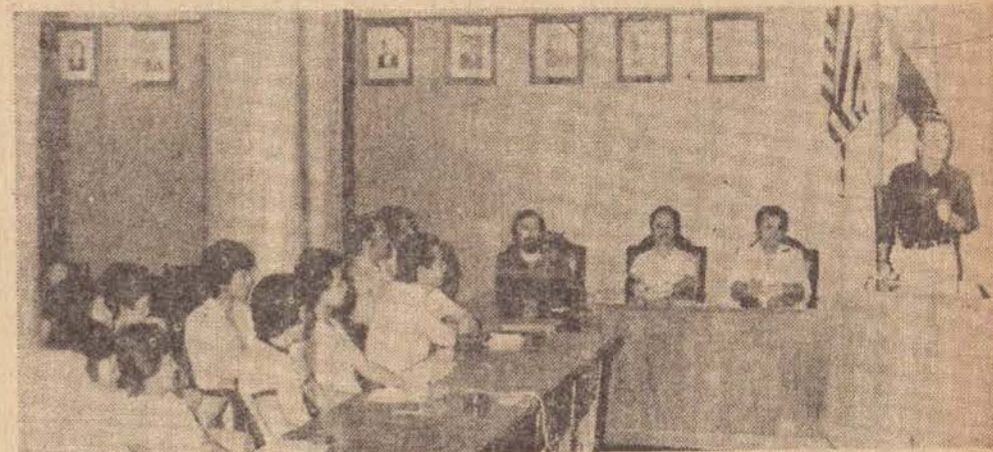
Aspecto do I Encontro de Relojoeiros em Presidente Prudente.