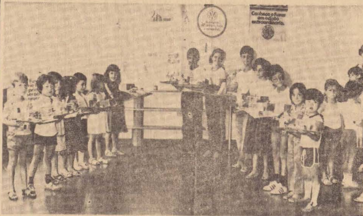
Na foto, parte dos alunos premiados no concurso, exibindo os seus respectivos trabalhos.

A Cia. Prudentina de Automoveis, Revendedor Autorizado Volkswagen, aproveitando a campanha Pep-Brink, criada pela Volkswagen do Brasil e Associação Brasileira de Revendedores Autorizados, Assobrav, campanha essa de âmbito nacional, promoveu junto aos Colegios Cristo Rei e Esqueminha, um concurso para montar, colar e colorir o material distribuído pela Cia. Prudentina de Automoveis.