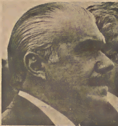
Dívida interna: o fantasma de Sarney

Esta demanda muito forte tem facilitado o ajuste de preços entre os diversos setores produtivos. Neste ajuste, que é onde se decide quem pagar a conta do tabelamento dos preços de venda, as grandes empresas têm conseguido empurrar as perdas sobre as menores. É que os preços anteriores a março embutiam uma estimativa de inflação, que deve agora ser descontada, pois o tabelamento impede que esta estimativa seja de fato repassada nos preços de venda. Concedendo descontos pequenos, os grupos monopolistas preservam seus lucros, às custas dos fornecedores e dos comerciantes. Porém, com a demanda intensa e as vendas crescendo, as empresas pequenas e médias po-