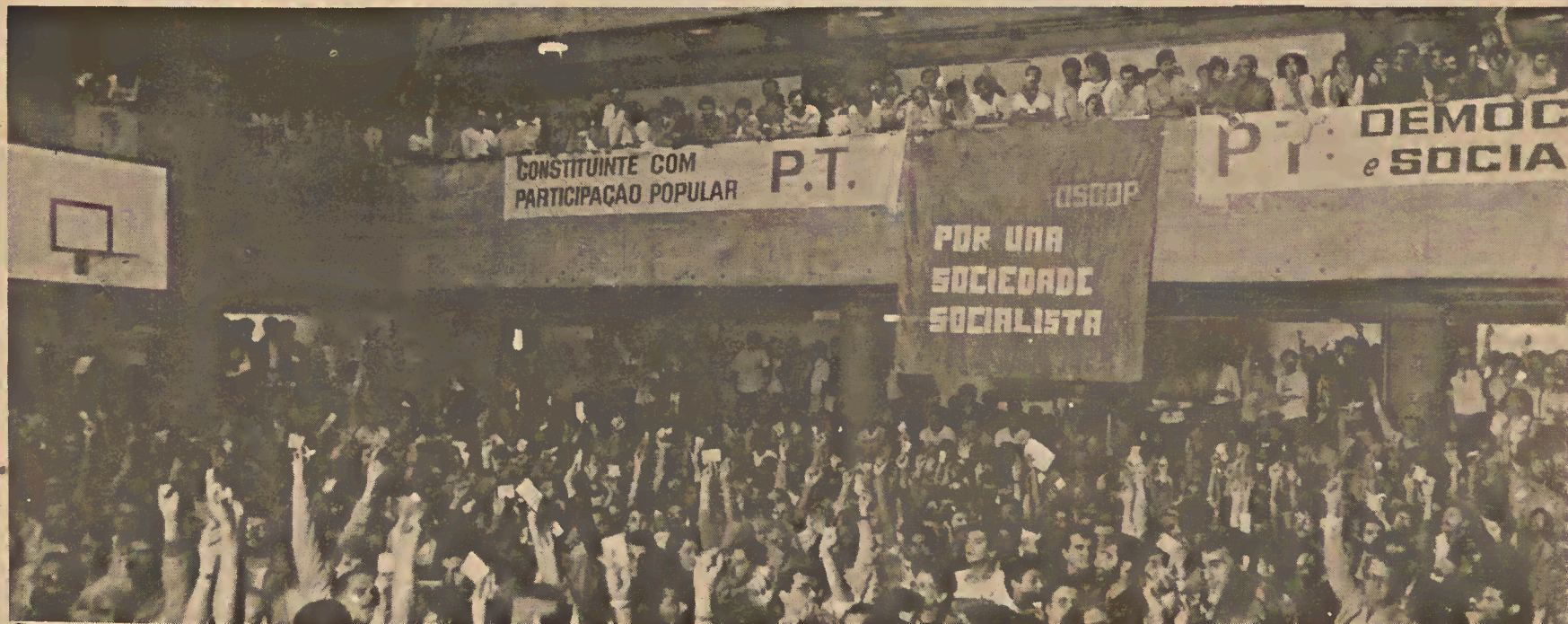
Com 1300 delegados, o Encontro Estadual discutiu e escolheu os candidatos do PT.