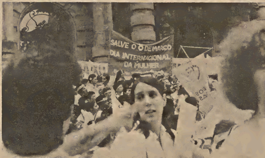
Mulher: presença cada vez maior nas lutas sociais do país.

capitalismo. Quando as mulheres se põem em luta contra sua opressão específica, indo às bases dessa opressão, isto é, compreendendo o papel que esta opressão exerce na manutenção da opressão e da exploração de uma classe por outra, estão trilhando um caminho revolucionário, atingindo alguns dos pilares de sustentação do capitalismo. Estão lutando contra a forma da família nuclear, patriarcal, que cumpre papéis econômicos sociais e ideológicos na manutenção do capitalismo. Estão lutando pela coletivização do trabalho doméstico, que é uma luta contra os patrões e contra o Estado, que se apropriam do trabalho gratuito das mulheres; contra o controle autoritário sobre seu corpo, sua sexualidade e sua função reprodutiva; contra a ideologia machista que sustenta essa opressão. Estão lutando contra sua super-exploração na condição de um setor particular dos trabalhadores assalariados, ainda mais explorados dos que os homens.”