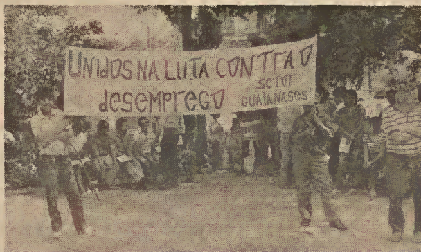
Reconhecer a miséria de milhões de brasileiros é o único mérito do pacote social

Após o plano do Cruzado, baixado por um decreto-lei, sem qualquer discussão ou consulta prévia à população, o "Brasil 2000" é a última novidade dentre os grandes projetos de impacto da chamada Nova República. Felizmente, porém, pouca gente acreditou na seriedade de mais este pacote embrulhado com papel de presente. Tanto que ele não causou quase nenhuma polêmica.