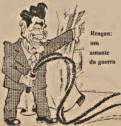
Reagan: um amante da guerra