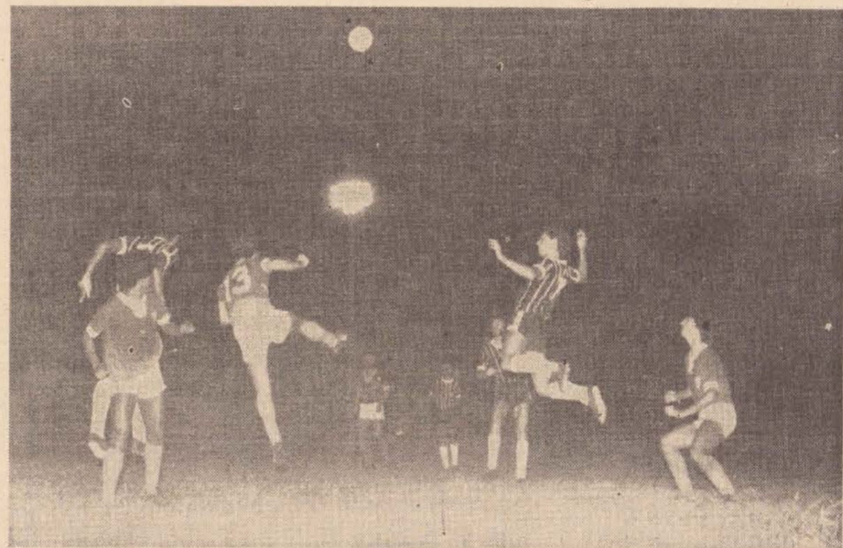
O ataque alvinegro exerceu grande pressão sobre o Noroeste no segundo tempo, mas não encontrou o caminho das redes adversarias. Neste lance a reta-guarda noroestina se defende de qualquer maneira.

Afinal, todos merecem ver o futebol que Guarani e Flamengo estão jogando atualmente. (AE)