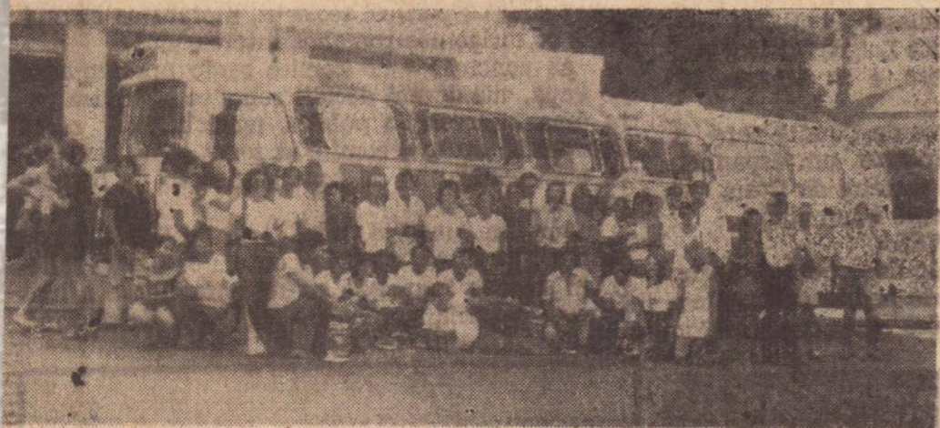
Universitários alagoanos do Projeto Rondon fizeram breve evolução por Presidente Prudente.

Em ônibus especial da Andorinha, deixou Presidente Prudente a noite passada, uma equipe de estudantes universitários do Estado de Alagoas, que desde 15 de janeiro aqui esteve participando da Operação Rondon. Uma outra equipe saiu de Piqueroibi pelo último trem da Fepasa.