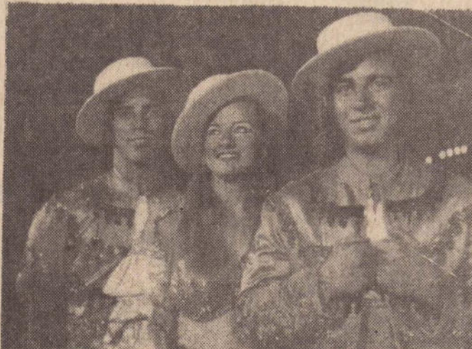
Eles são os artistas principais do Circo.

As visitas ao Zoológico Ambulante, podem ser feitas no período matinal, Sábado e domingo matinal, das 20h30. A direção do Circo Real Madrid recomenda ao publico que faça a reserva antecipada de camarotes e cadeiras numeradas, a fim de evitar aglomerações às bilheterias, que estarão abertas a partir das 10h00 da manhã.