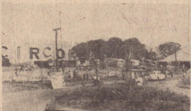
Ontem, era grande a afluência ao local.