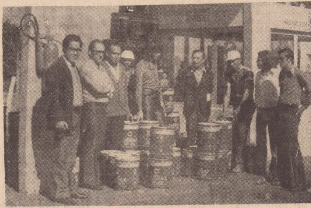
Na foto, os representantes da Petrobrás e o chefe da Erplan-10

distribuição de seus produtos na Alta Sorocabana e regiões próximas.