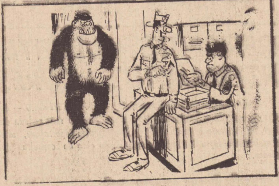
Chegou o seu substituto, sargento!

FAÇA SEGURO! Oferecemos nossa experiência em seguros de: • Automóvel • Vida • Acidentes pessoais • Incêndio • Responsabilidade Civil obrigatória e facultativa • Lucros cessantes • Fidelidade • Transportes • Vidros • Roubo Assistência permanente e amplo financiamento MOTTA CORRETORA E ADMINISTRADORA DE SEGUROS LTDA. S/C Rua Tte. Nicolau Maffei, 86 - Fone 3-4822 - P. Prudente