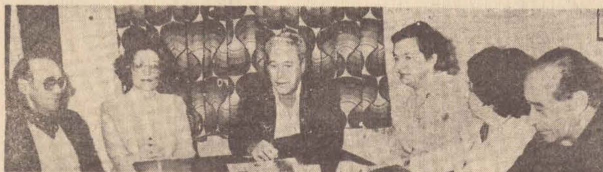
Os membros da comissão, ontem cedo em nossa redação.

vales, e vão beneficiar Vila Brasil, Vila Líder e Vila Rainho. Com referencia ao quarto projeto, o mesmo foi encaminhado a Secretaria do Interior para posterior aprovação devendo beneficiar a zona leste da cidade, orçado em 32 milhões de cruzeiros, sendo a execução em 150 dias. Serão atendidos beneficiados com a implantação de dois quilômetros de galeria, Parque Alvorada, Jardim Itatiaia, Vila Líder, Jardim Santa Marta.