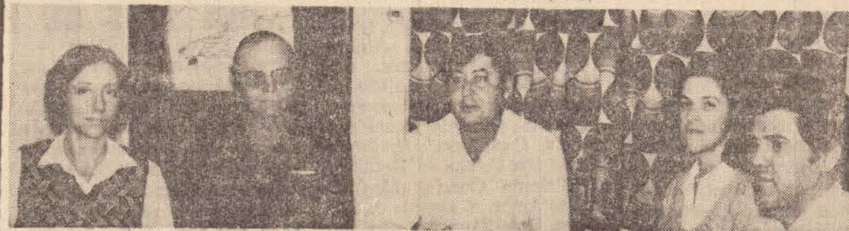
Os visitantes em nossa redação.

As visitantes continuarão viagem para São Paulo, Santos e posteriormente irão ao sul, onde o assunto será estudado em outro ângulo, em virtude da atual situação do transportador naquela região.