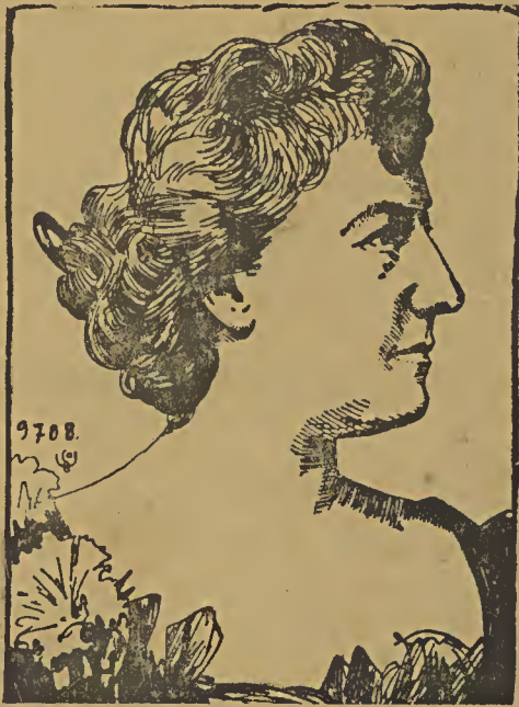
Prinzessin Luise von Koburg, gegen die jetzt Strafanzeige erstattet wurde.

geringer Tiefe so sauerstoffarm und reich an Schwefelwasserstoff, daß der Aal dort nicht leben kann. Er unternimmt, und zwar stets zur Nachtzeit, weite Wanderungen vom Meere aus stromauf, um sein Fortpflanzungsgeschäft zu besorgen. Dabei legt er anderthalb bis vierundzwanzig Kilometer zurück. Bei diesen Wanderungen gibt es kein Hindernis, selbst der Rhein- und Rhonefall wird genommen, und die Leichen der im Kampfe Erliegenden dienen den Nachkommen als Stützpunkt für das Vorwärtsschreiten. Fünf bis sechs Jahre bleiben die Aale in den Flüssen, dann rüsten sie sich zur Brautfahrt ins Meer. In stürmisch finsternen, besonders warmen Nächten, in Gesellschaft von dreißig bis vierzig Genossen wird sie angetreten. Oft halten sie sich dicht ungeschlungen. Als Nahrung nimmt der Aal allerlei Wassertiere zu sich: Würmer, Frösche, Fische u. a. m., und in den Monaten der guten Jahreszeit ist er ein Vielfraß, im Winter hält er sich tief im Schlamm verborgen.