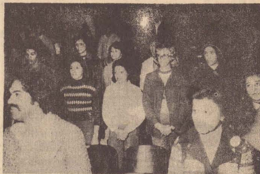
Uma parte dos formandos juntamente com os convidados