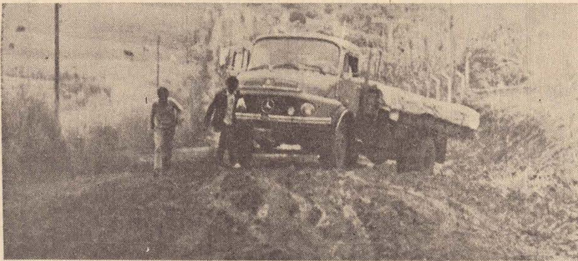
Este caminhão de mantimentos não conseguiu chegar ao hospital que está praticamente isolado há dois dias.