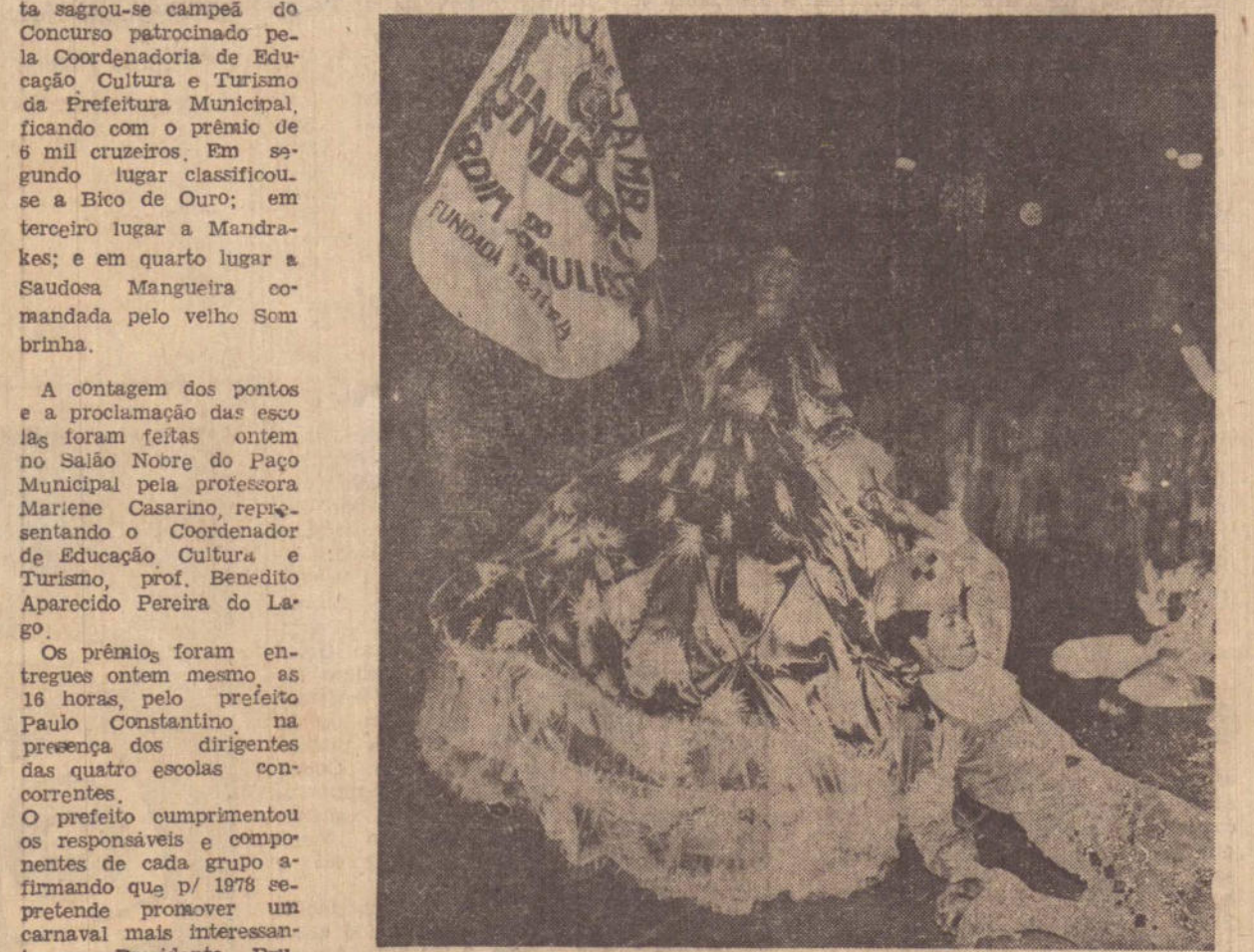
Porta-estandarte da Unidos do Jardim Paulista, quando fazia sua evolução pela Nicolau Maffei.