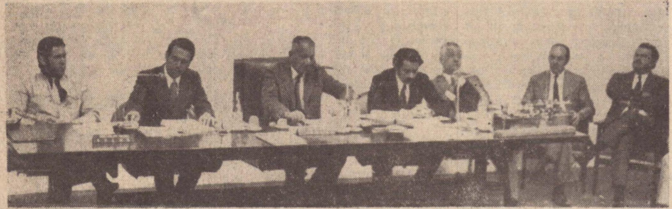
Um flagrante da Mesa da Edilidade, aparecendo em primeiro plano o prefeito Walter Lemes Soares, diversos vereadores e alguns assessores do Executivo.

Atendendo convite formulado pela Câmara Municipal, o prefeito Walter Lemes Soares compareceu ontem àquela Casa, para dar um balanço de sua administração e responder uma série de perguntas dos integrantes do corpo legislativo.