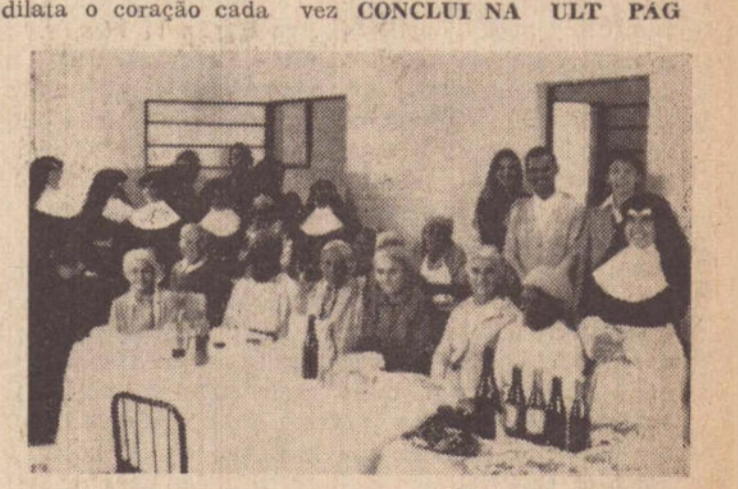
As velhinhas, fotografadas à mesa de refeição, la-deadas pelas irmãs e benfeitores.

pelos braços das irmãs, que recebem um ancião desamparado.