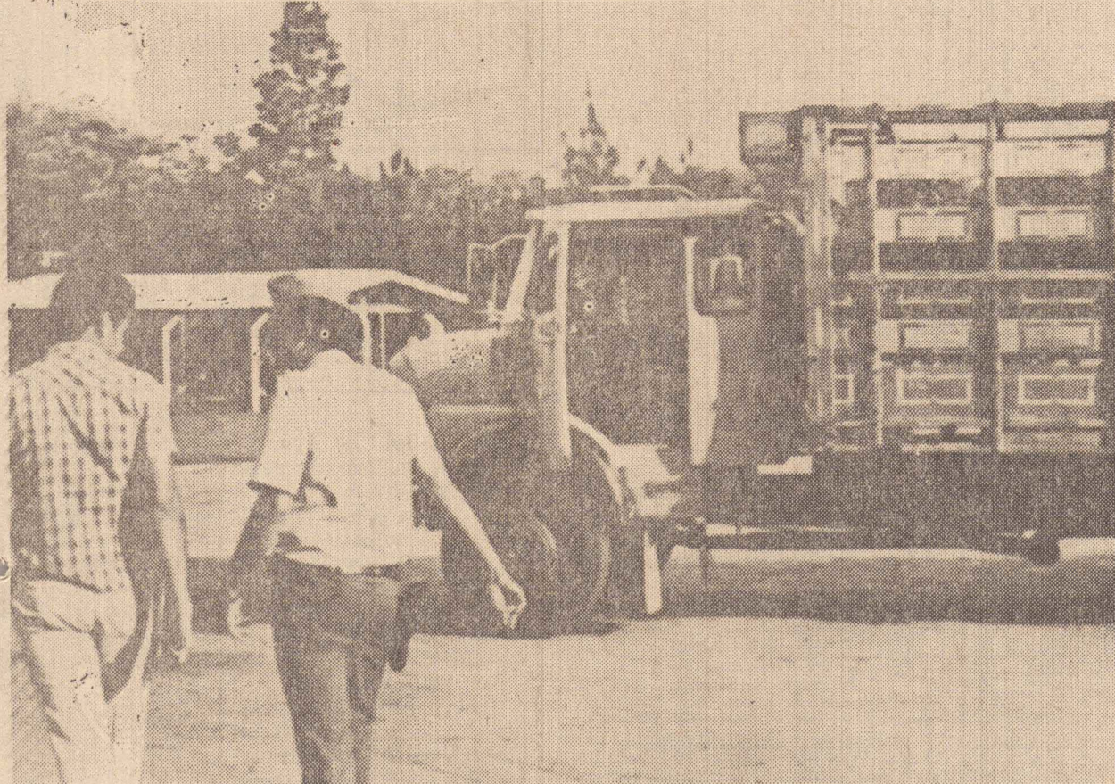
A polícia foi chamada ontem a intervir a prendeu um caminhoneiro.