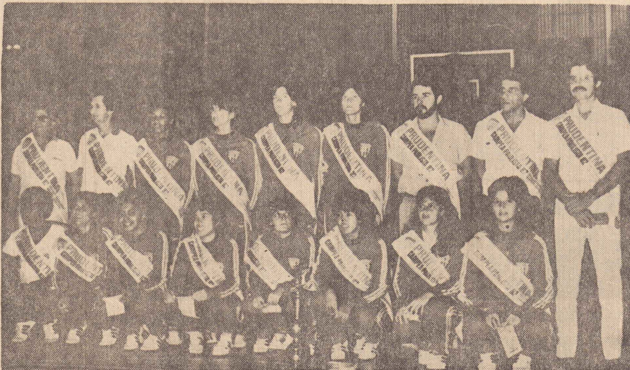
Prudentina - Campeã Paulista de 1982 - busca seu primeiro título internacional.

Ele explicou que o governo federal vai negociar com os produtores um preço para o leite independente do ICM, que passará a ser um problema de cada estado que arcará com o ônus de sua decisão.