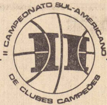
TABELA DE JOGOS