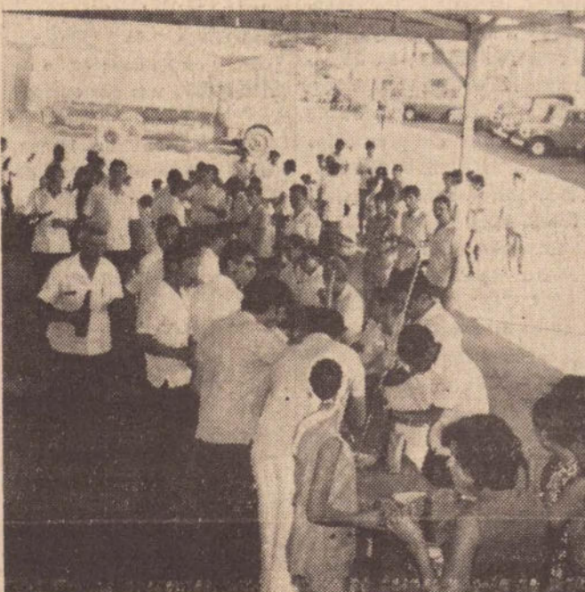
Três firmas presentes, uma família só despedindo-se de 1970.