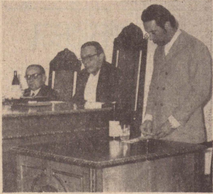
Em solenidades realizadas ontem, tomou posse a nova diretoria do Sindicato Rural de Presidente Prudente, eleita no último dia 6 de julho.