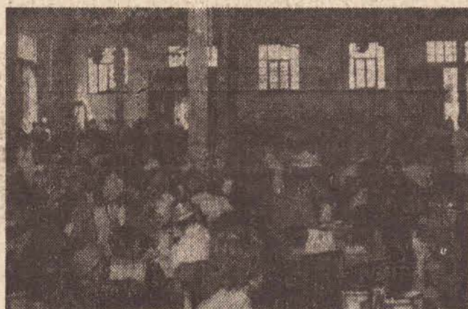
Um aspecto do grande salão da I.R.F.M. colocado à disposição dos promotores da Festa do Vinho.

A Casa de Portugal, realizou domingo passado, em Tupã a sua tradicional "Festa do Vinho", regis-