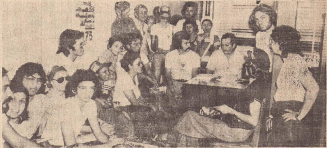
Um aspecto da visita da equipe do Projeto Rondon na redação deste jornal.

Eles não estavam estranhando o nosso clima que segundo eles "tem alguma semelhança com várias regiões do Nordeste".