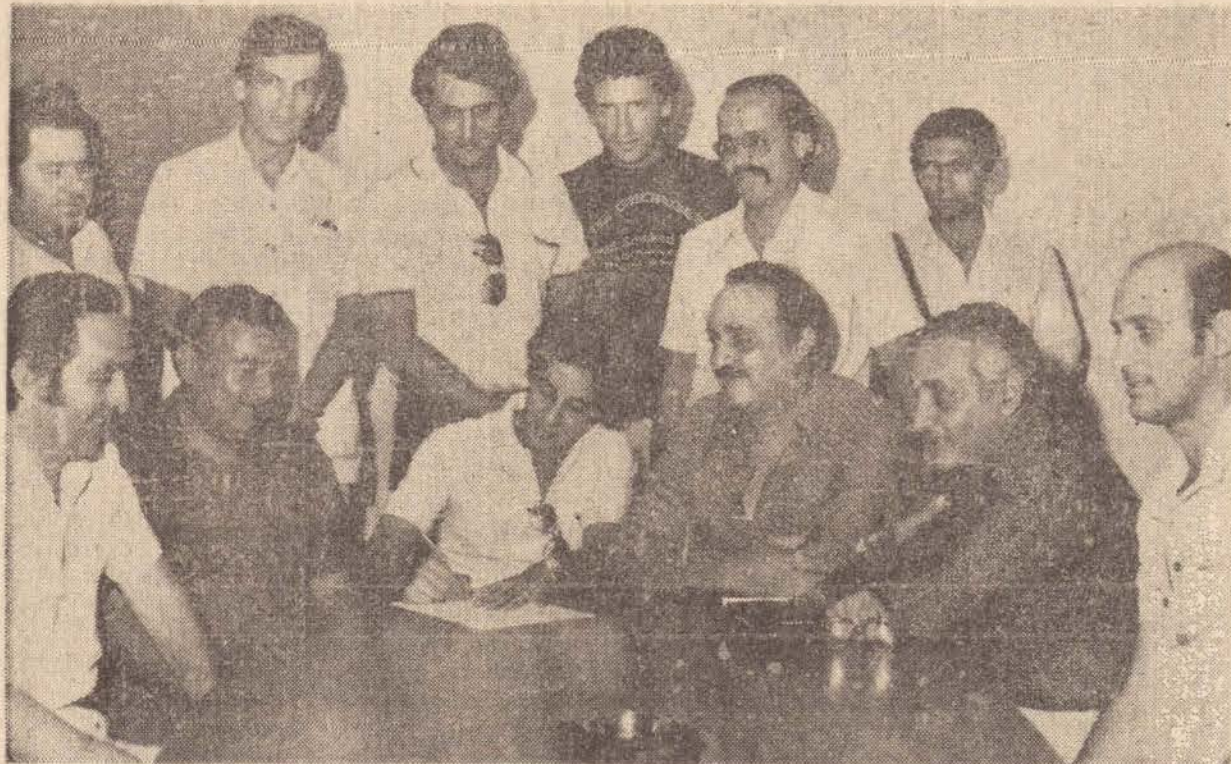
O técnico da Seleção Argentina de Ciclismo, foi contratado pelo Grupo Zacharias, para montar e treinar a equipe de Presidente Prudente.