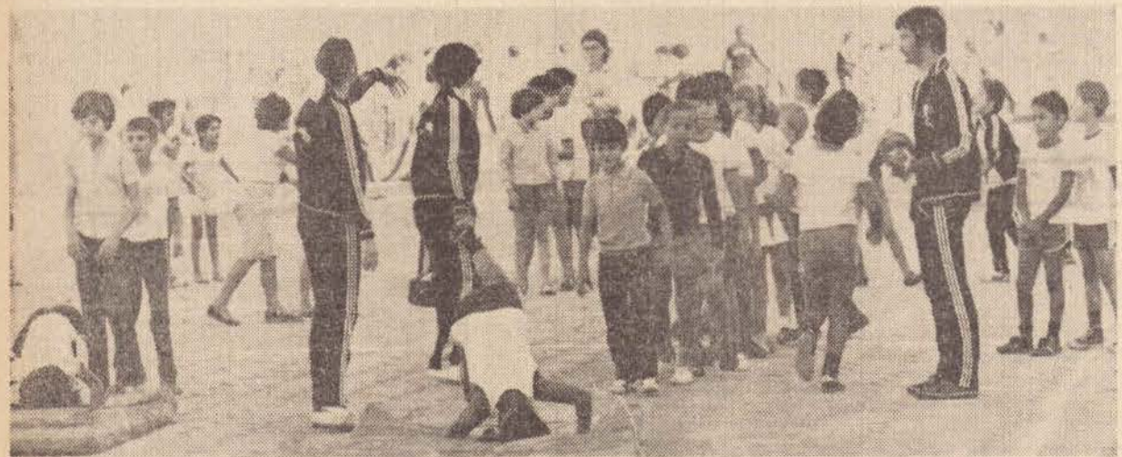
Flagrante colhido no ultimo domingo, durante a realização da Manhã de Lazer no Parque de Uso Múltiplo

rem, serão automaticamente convidados a formar na equipe da Amepp, que treina todas as segundas, quartas e quintas, das 7:30 hs. as 10:30 no salão da ACAE. É mais uma oportunidade que a AMEPP oferece aos amantes do tenis de mesa de participarem do referido campeonato que naturalmente levará um grande público para assisti-lo.