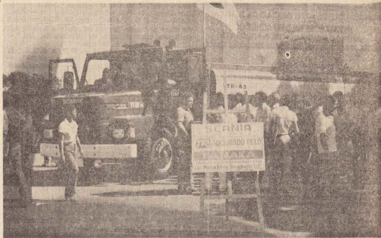
A primeira unidade T 112.MA, lançada em Pres. Prudente pela concessionária SCANIA, a MOVEPA ficou exposta diante da Catedral de S. Sebastião, sendo admirada por todos que a conheceram de perto.

CONVITE — Os Grupos de Alcoólicos Anônimos e Al-Anon de Presidente Prudente vêm convidar V. Sa. e Digníssima Família para com a sua inestimável presença prestigiar a 1.ª Reunião Pública que faremos realizar no dia 30 de maio de 1981, as 20 horas, no Salão de Festas da Igreja N. S. do Carmo, na Vila Maristola, à rua Paraguai, n.º 68. É esse, na íntegra, o teor do convite que recebemos, da Comissão que está organizando uma associação também especializada na humaníssima missão de reabilitar pessoas que têm problemas de alcoolismo. Fazemos o convite que recebemos, extensivo à população de Prudente.