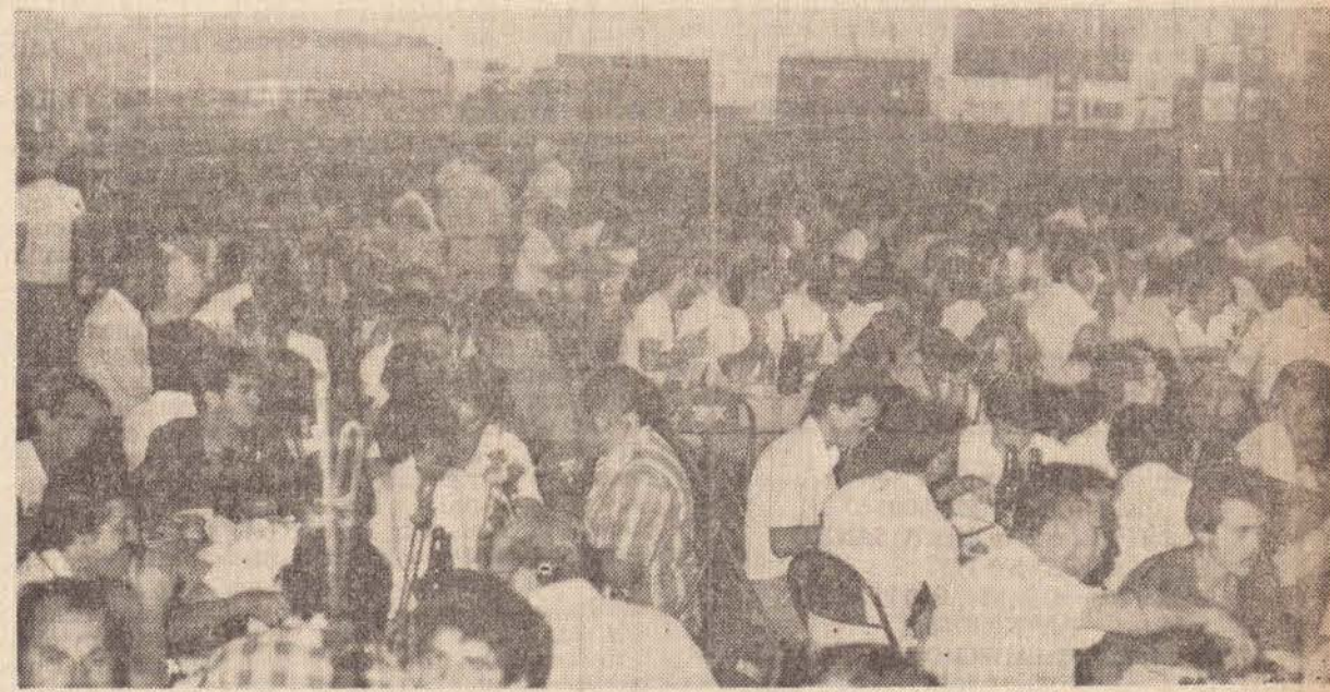
Um aspecto parcial do churrasco de confraternização promovido pela MOVEPA — Concessionária Scania em Pres. Prudente — na noite de sexta-feira última.

Domingo próximo, o jornal "O Imparcial" nos trará em matéria especial o que vem fazendo Tanaka Transportes Rodoviários Ltda — em benefício do desenvolvimento e integração nacional.