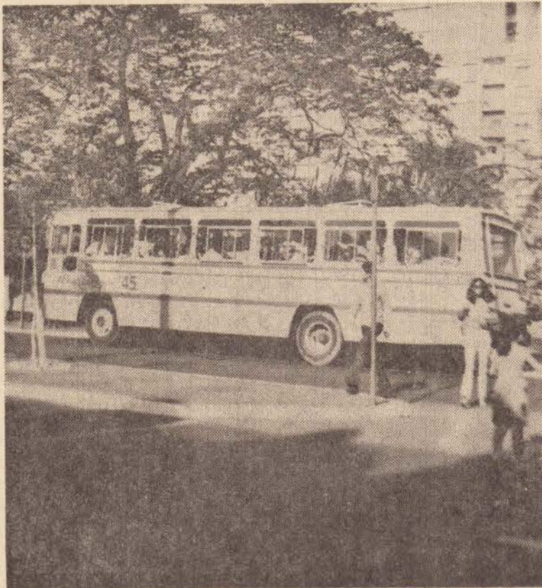
A tarifa da circular custa Cr 22,00 e pode chegar a 30

BRASILIA, (AE) — Os bancos fecham na próxima sexta-feira e só reabrem ao meio dia da quarta-feira de cinzas, quando deverão atender ao público pelo menos três horas. O Banco do Brasil já alertou que os depósitos em cheque efetuados na sexta ou na quarta-feira de cinzas poderão ficar bloqueados até quinta, quando voltará a haver sessão de devolução na câmara de compensação.