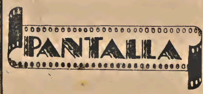
«Les temps modernes»