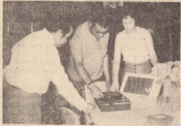
Para nós, uma demonstração da Eletrola Empire 2.042 em nome de GTE-Sylvania.

Em matéria de Televisão, EMPIRE é o aparelho indicado para a nossa região, pois foi especialmente adaptado para as condições brasileiras. "EMPIRE" capta som e imagem à grandes distâncias, mesmo em local de difícil recepção. "EMPIRE" — um produto GTE-Sylvania é encontrado na Brasimac e Brasútil.