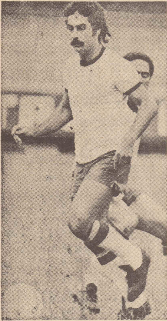
Roberto Rivelino assediado por dezenas de repórteres em Teresópolis, admite sua deslocação para a ponta esquerda.