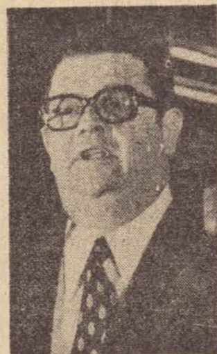
Delfim Netto, 6%