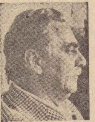
Janio Quadros, 17%