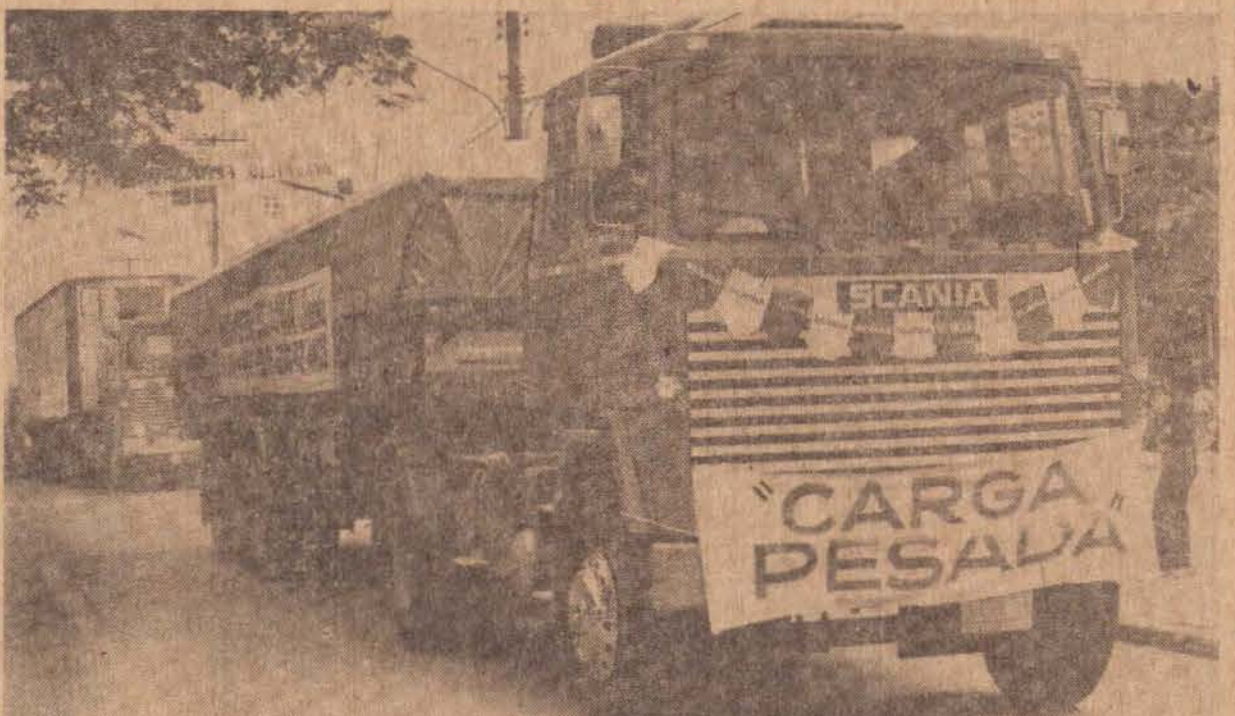
Desfilando pela Av. Cel. Marcondes, os veículos "Carga Pesada" da linha Scania representada pela MOVEPA.