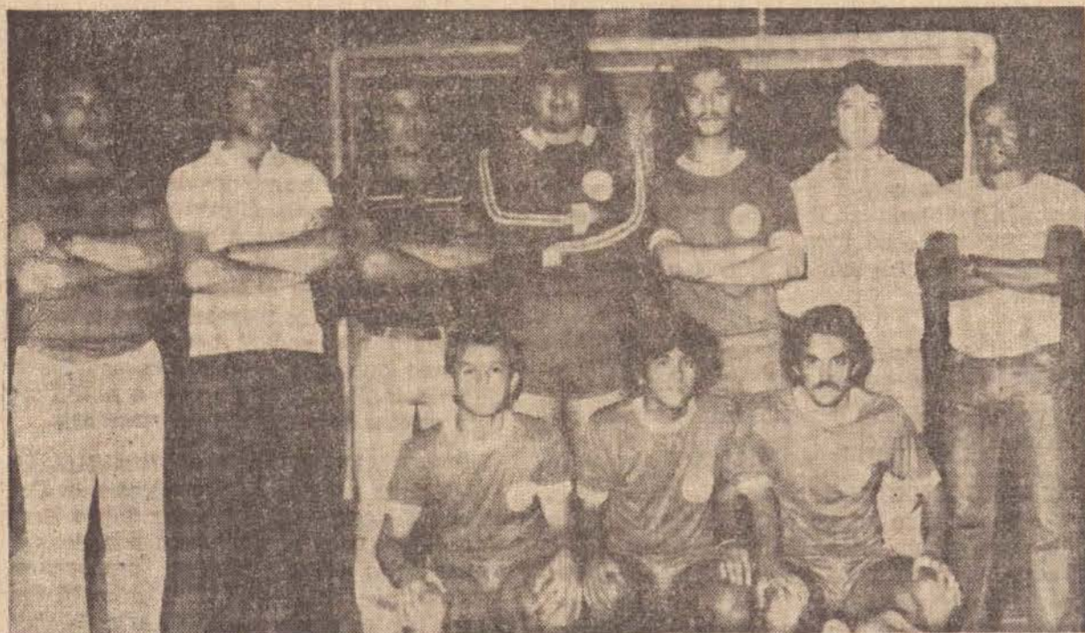
Equipe do Ipanema Clube, que com mais alguns reforços participará do Campeonato Paulista de Futebol de Salão

Terá início no próximo dia 28, o Campeonato Paulista de Futebol de Salão, promovido pela Federação Paulista de Futebol de Salão, e duas equipes de nossa cidade, estarão participando do referido campeonato.