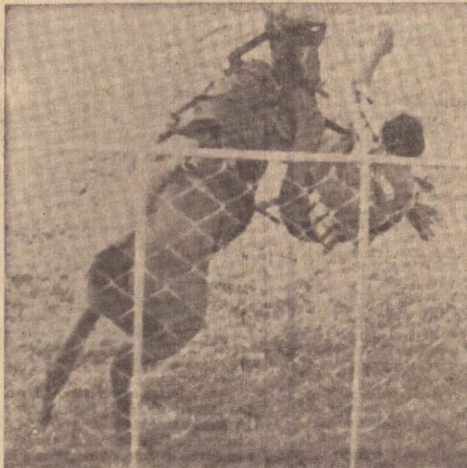
Muitos espectadores vibram com a queda do peão, enquanto "Zé do Prato" proclama: v. vai para o jornal...