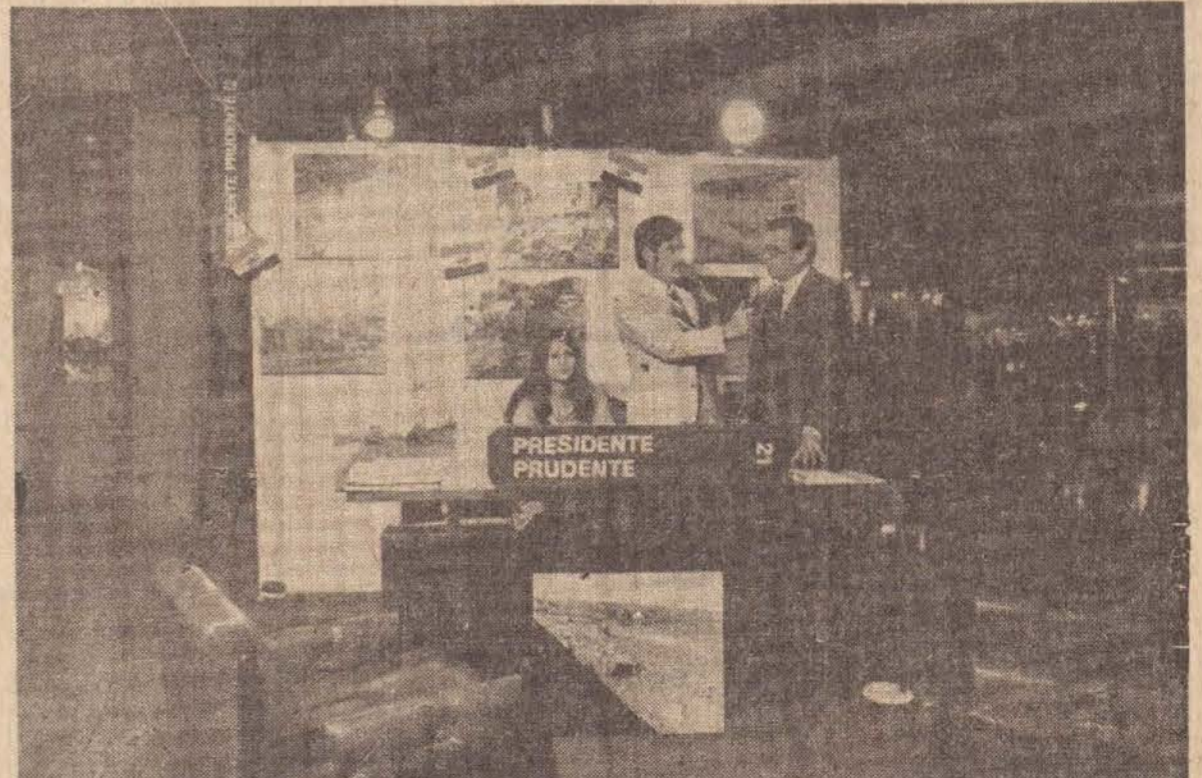
I CONGRESSO DE DESCONCENTRAÇÃO DO CRESCIMENTO INDUSTRIAL E URBANO I MOSTRA DE VIABILIDADE DA DESCONCENTRAÇÃO INDUSTRIAL E URBANA 12 a 14 de setembro de 1979 • Palácio das Convenções do Parque Anhembi • São Paulo — SP.