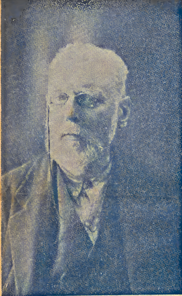
Nettlau en España. 1911.

El peor enemigo de la libertad y de todo progreso social es el dogma, consecuencia, en la mayoría de los casos, de ese fanatismo que cree en la posesión de la verdad absoluta, válida e indiscutible para todos, y, por esa misma razón, destinada a convertirse en el enemigo jurado de todo progreso. Cualquier despotismo, sea religioso, político u otro, debe menos su existencia a brutales medios de imposición que a la sorda fe en su irrevocabilidad, la cual, alimentada y fortalecida sistemáticamente por los gobernantes, termina por instituirse como fundamento de la educación, hábito y tradición. Tan pronto como esa fe irreflexiva pierde su predominio y el respeto servil de las multitudes se va derrumbando, la fuerza y el prestigio de las instituciones tradicionales. Estas cederán, tarde o temprano, ante conceptos nuevos y tentativas de renovación social, ya que han perdido sus soportes morales, infundiendo a sus propios defensores la indecisión y la debilidad, por lo que se ven obligados a adaptarse a las nuevas condiciones.