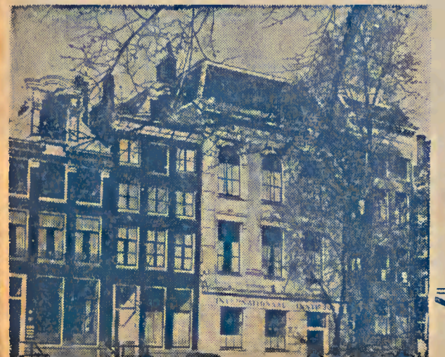
Instituto Social de Amsterdam.

la que ofrece la mejor garantía de una próspera cooperación de todos, el bolchevismo, como los sistemas anteriores, no supo hacer otra cosa que intentar una quimérica unidad, y enemigo declarado de toda otra experiencia, es incapaz distinguir la paja del grano.