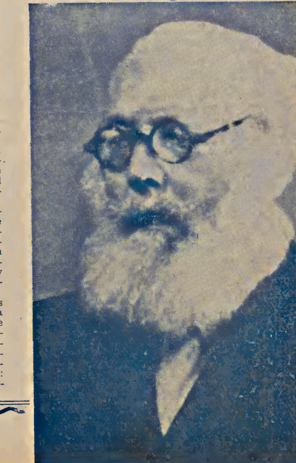
Nettlau en vísperas de su muerte.

El mismo Nettlau sabía perdonar los excesos de temperamento, más respetaba ciertos límites en la conducta frente al prójimo, que sólo podían ser violados al precio de la dignidad propia. Sostenía siempre que no se debía humillar al hombre, pues comprendía claramente que, herido el sentimiento de dignidad se hacía imposible toda inteligencia, originándose con ello, sin necesidad, antagonismos y rencores. Sin renunciar jamás a sus convicciones, las defendía con tacto y respetaba las opiniones adversas, siempre y cuando se inspiraran en intenciones honradas y se expresaran con sinceridad. Esa pureza de corazón y humana bondad era, precisamente, lo que hacía que le quisieran todos los que tuvieron la dicha de conocerlo. Parecía a menudo algo anticuado en sus conceptos, mas era siempre, con su honda sensibilidad y libertad de espíritu, caballero. En pocas palabras: un carácter verdaderamente elevado.