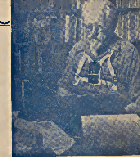
Reciente foto de Rocker.

Para concluir nos place recoger las palabras que Nettlau escribió en una carta con respecto a la conducta que debe presidir entre militantes y aludidos concretamente al caso del exanarquista Paul Pavlovich, quien, en su período atacó a Gustav Landauer en forma odiosa y llena de rencor personal: « La vituperación, lejos de ser un ar-