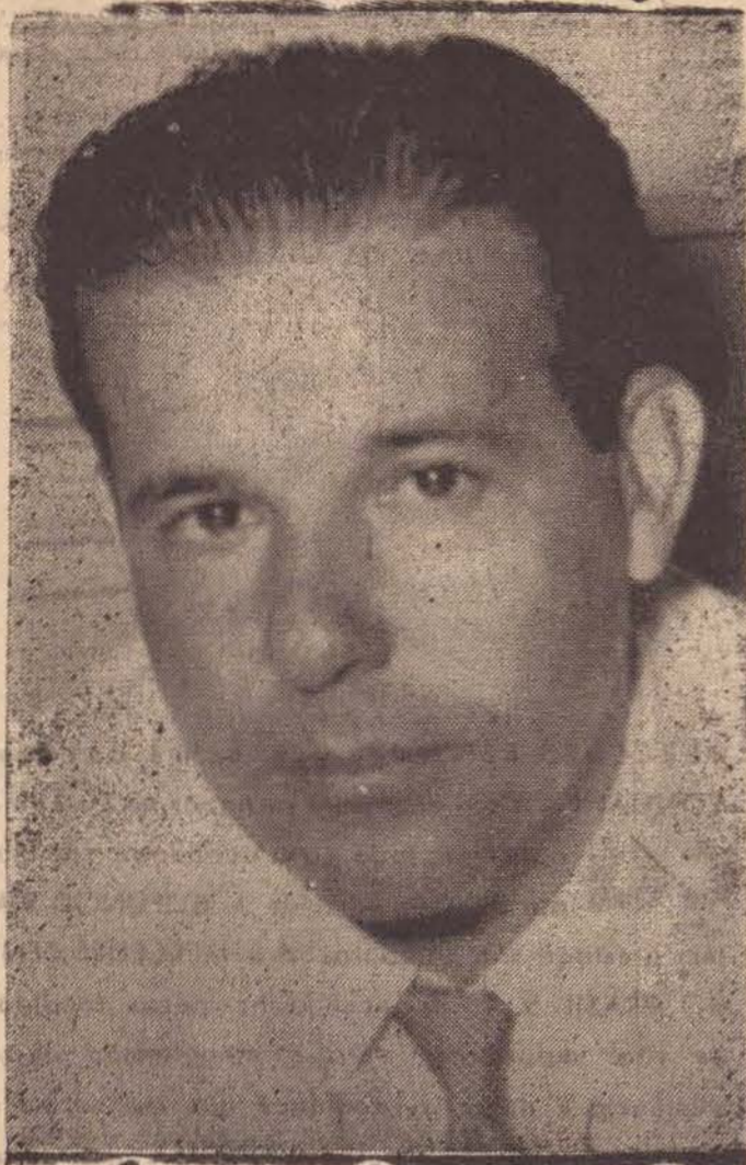
João Goulart, Presidente da República do Brasil

BRASÍLIA (Interpress) — Em encontro que durou pouco mais de meia hora, e terminou com um forte e carinhoso abraço do presidente João Goulart, a cada um dos membros do Gabinete ministerial, chegou ao fim, às últimas horas do dia 22 último, em cerimônia simples, realizada nos salões do Palácio Alvorada, o sistema parlamentar de governo. Para cada um dos ministros, o presidente teve palavras de agradecimento.